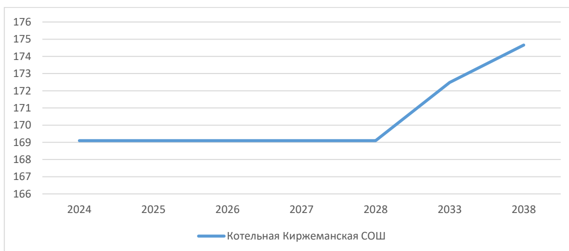
Рисунок 1. Динамика НУР топлива (утв.) на период 2024 - 2038 г.г

Прогнозы по отпускаемой тепловой энергии и топливопотреблению рассматривались по котельным, которые задействованы в схеме теплоснабжения, со следующим допущением: производство тепловой энергии ведомственной котельной остаётся на уровне базового года. Перспективное значение удельных расходов топлива на производство тепловой энергии приведено на рисунке 1 и в таблице 11.