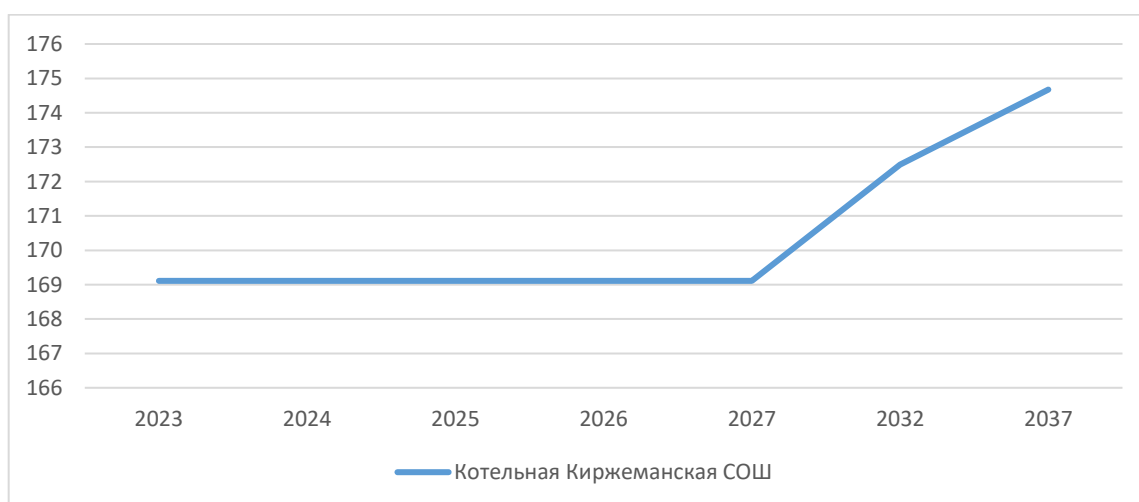
Рисунок 1. Динамика НУР топлива (утв.) на период 2023 - 2037 г.г

Прогнозы по отпускаемой тепловой энергии и топливопотреблению рассматривались по котельным, которые задействованы в схеме теплоснабжения, со следующим допущением: производство тепловой энергии ведомственной котельной остаётся на уровне базового года. Перспективное значение удельных расходов топлива на производство тепловой энергии приведено на рисунке 1 и в таблице 11.